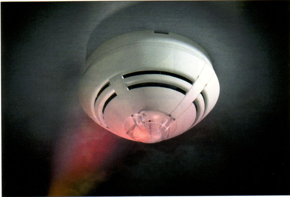
Der Brandmelder entstand im Rahmen einer globalen Formensprache für die Firma Novar BSS.

Design – Gutes Design gehört neben perfekter technischer Funktion zu den wichtigen Merkmalen erfolgreicher Produkte. Es löst Konflikte zwischen Ästhetik, Technik und Ergonomie. Was bringt das interdisziplinäre und integrative Zusammenarbeiten während des Entwicklungsprozesses?